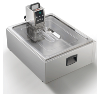
Vasca 2/1 gastro